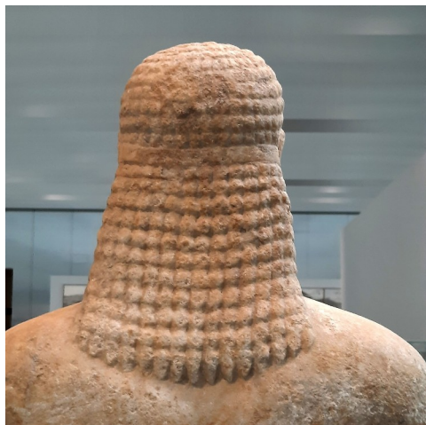
Jeune homme nu ( kouros ), marbre. Statue provenant du sanctuaire d'Asclépios, dieu de la médecine. Paros (île dans les Cyclades), Grèce vers 540 av. J.-C