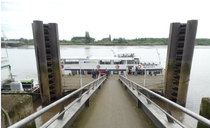
Le Mozart à quai avant le départ