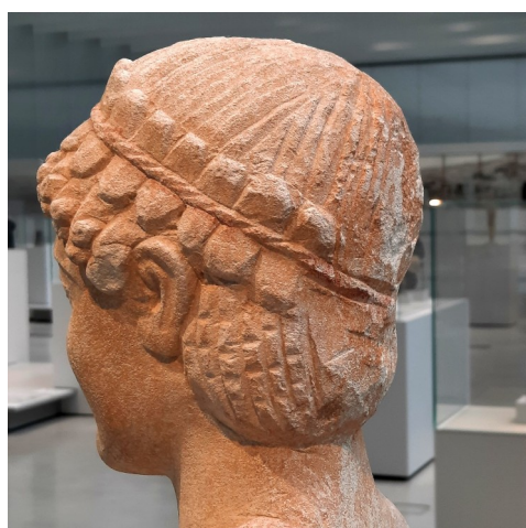
Jeune homme coiffé d'une couronne végétale, calcaire. Statue offerte dans un sanctuaire. Dali ? Chypre, vers 480-460 av. J.-C.