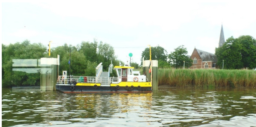
Village de Mariekerke et bateau passeur d'eau en jaune

Revenons à notre bateau et aux berges de l'Escaut. Les berges sont plantées de roseaux d'où peut s'échapper un héron. Les petits villages affleurent sous un ciel bien bas, les clochers émergent.