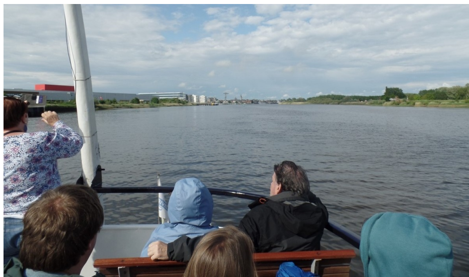
Vue depuis la proue du bateau

Quel bel itinéraire on pourra alors parcourir en bateau depuis Paris par Compiègne – Cambrai – Tournai – Audenarde – Gand – Anvers et Flessingue aux Pays-Bas.