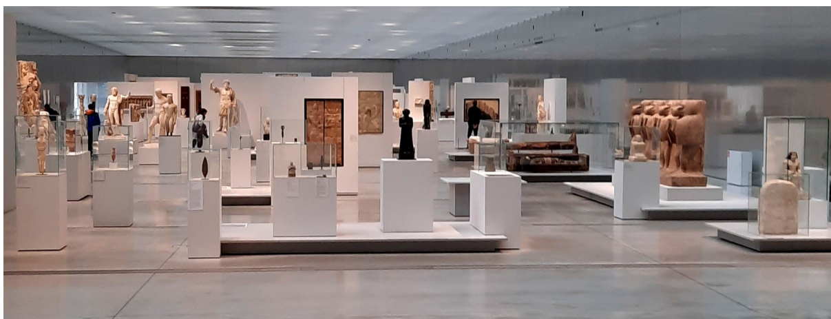
La Galerie du Temps

Oui, c'est un formidable voyage à travers 5 000 ans d'histoire de l'art et de l'humanité depuis l'Orient avec la naissance de l'écriture et qui se termine avec la révolution de 1830 en France.