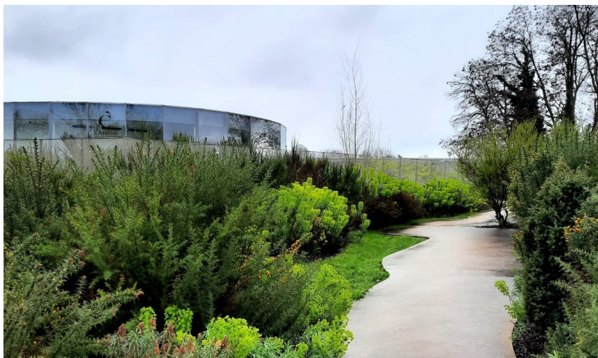
Un des chemins d'accès dans le parc

Les anciennes voies de chemin de fer reliant les puits de mine et maintenant bordées d'arbres, d'arbustes, de vivaces et de prairies fleuries nous invitent jusqu'aux portes du musée. Le parc paysager de 20 ha, récompensé par le label de Jardin Remarquable en 2012, est l'œuvre de l'architecte paysagiste Catherine Mosbach .