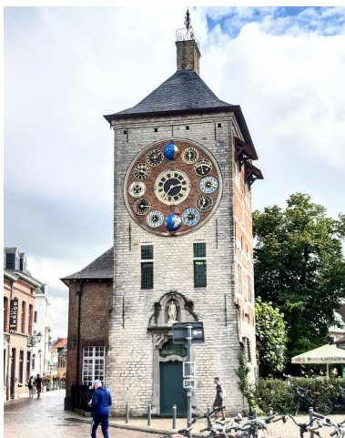
La Tour Zimmer

Rendez-vous à 10 h 20 à la gare de Bruxelles Central, salle des guichets (café Starbucks) pour départ à 10 h 38 en direction de Turnhout. Arrivée à Lierre à 11 h 20. A Lierre, nous rejoignons la belle Grand-Place et son Hôtel de Ville, soit à pied, soit en autobus De Lijn (distance 1 km, prévoyez une carte De Lijn si vous préférez effectuer le trajet en bus). Nous déjeunons à la terrasse du café/brasserie « Het Moment » avec vue sur la Grand-Place (environ 15 euros pour un menu). Ensuite, visite libre du Musée Zimmer et de la Tour Zimmer connue pour ses horloges et ses multiples cadrans, œuvre d'une vie d'un mathématicien, horloger de génie (1888-1970). Son œuvre compte 93 cadrans et 14 automates en état de marche.